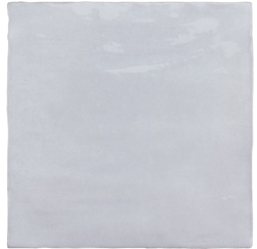
Satin Lavanda 5x5 73SAT-LAV-55 Size: 5.2x5.2"