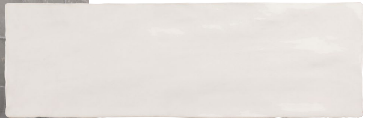
Satin Blanco 2.5x8 73SAT-BLN-258 Size: 2.58x7.9"