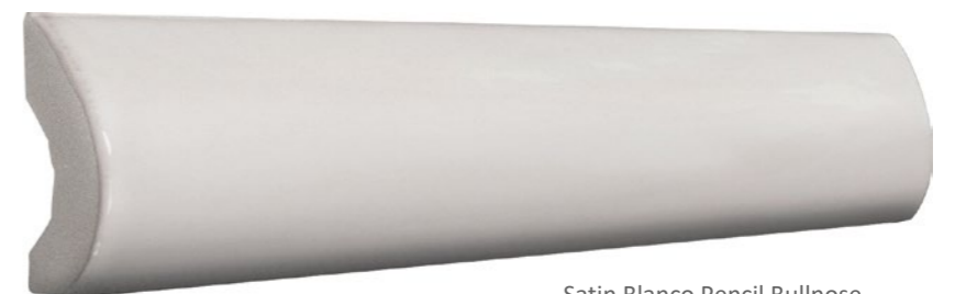
Satin Blanco Pencil Bullnose 73SAT-BLN-PEN Size: 1x8"