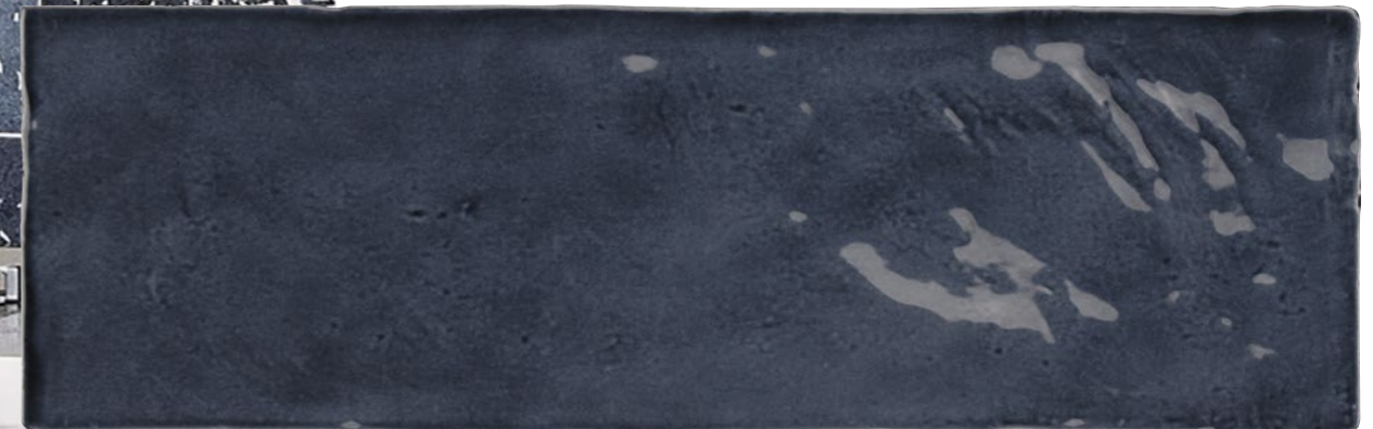
Satin Reef 2.5x8 73SAT-RF-258 Size: 2.58x7.9"