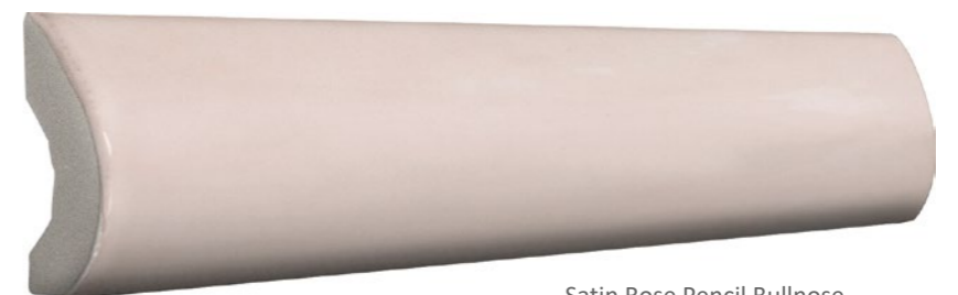
Satin Rose Pencil Bullnose 73SAT-ROS-PEN Size: 1x8"