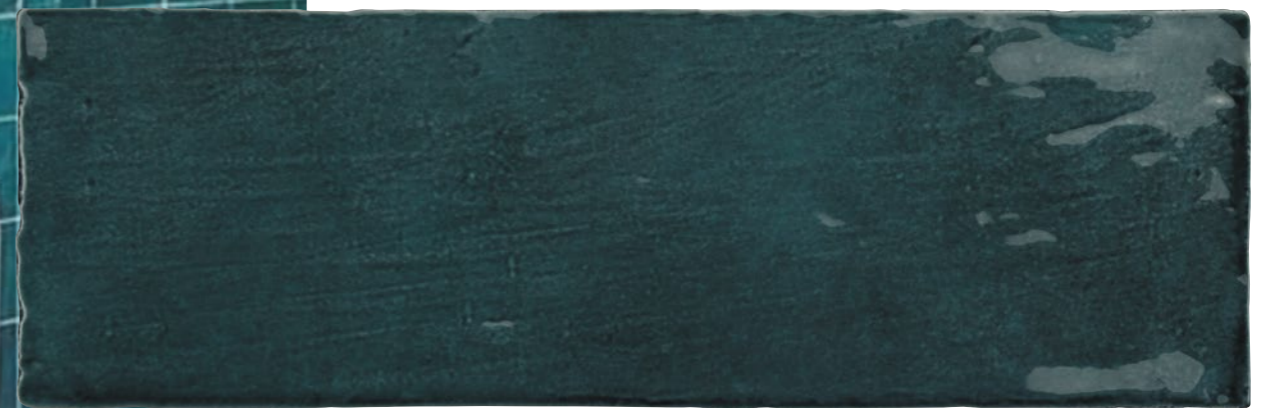
Satin Quetzal 2.5x8 73SAT-QTZ-258 Size: 2.58x7.9"