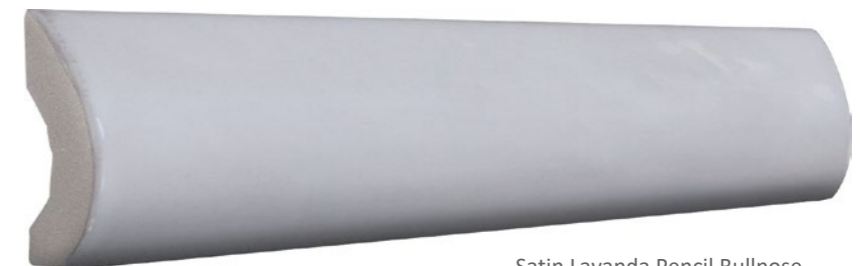
Satin Lavanda Pencil Bullnose 73SAT-LAV-PEN Size: 1x8"