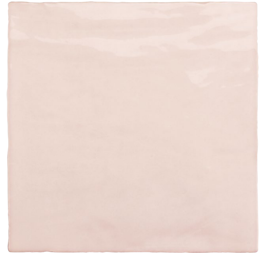
Satin Rose 5x5 73SAT-ROS-55 Size: 5.2x5.2"