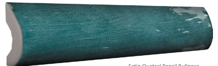
Satin Quetzal Pencil Bullnose 73SAT-QTZ-PEN Size: 1x8"