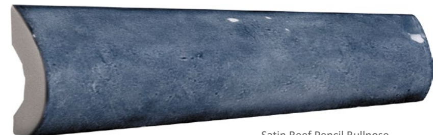
Satin Reef Pencil Bullnose 73SAT-RF-PEN Size: 1x8"