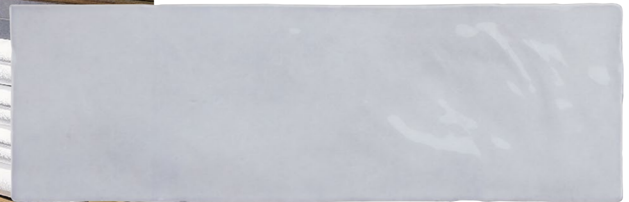
Satin Lavanda 2.5x8 73SAT-LAV-258 Size: 2.58x7.9"