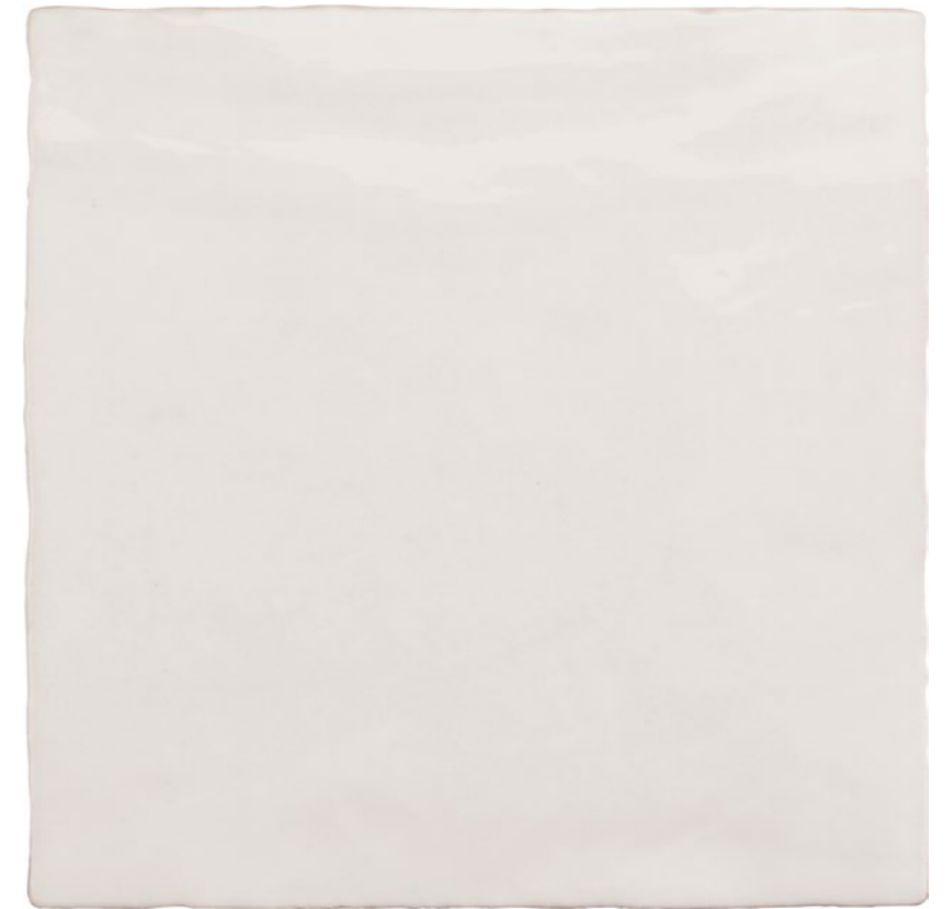
Satin Blanco 5x5 73SAT-BLN-55 Size: 5.2x5.2"