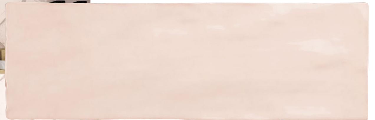
Satin Rose 2.5x8 73SAT-ROS-258 Size: 2.58x7.9"